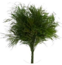
TREE FERN / TIKKI